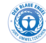
Ekoznačka Německa – Der Blaue Engel