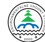
Ekoznačka Slovenské republiky